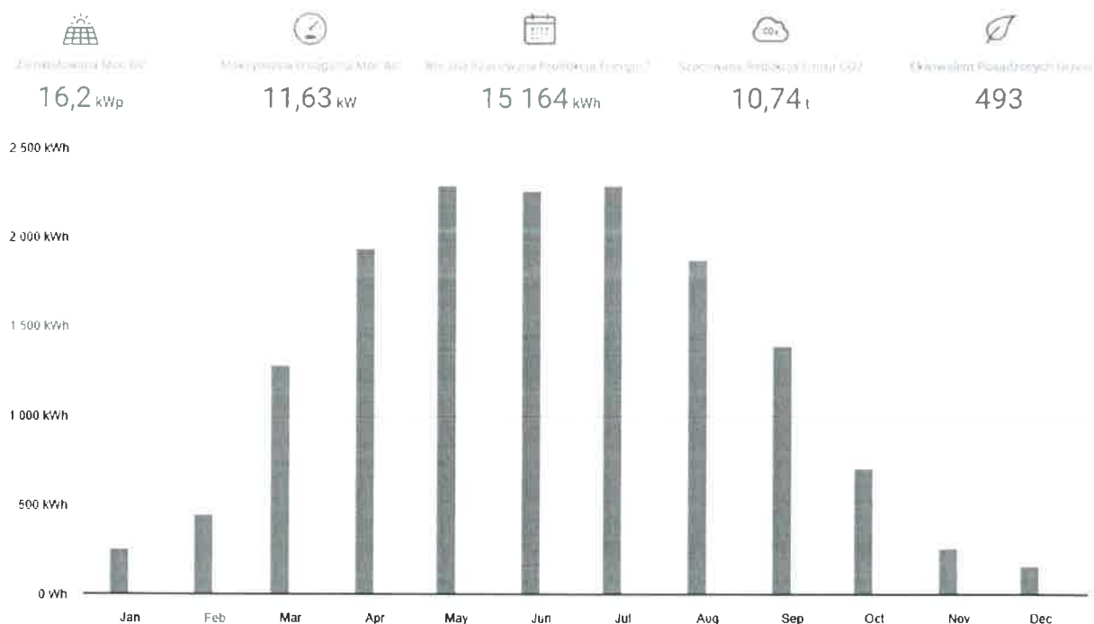
Rys. 3 Prognoza uzysku w skali roku

Dla zestawu 16,2 kW prognozy uzysku określono: